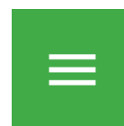
Menu ad hamburger

Per accedere alla sezione dei tuoi gruppi, devi accedere al tuo account SBC e selezionare il pulsante del menu ad hamburger nell'angolo in alto a destra dello schermo: sul lato sinistro comparirà una barra di navigazione, dalla quale potrai selezionare Gruppi .