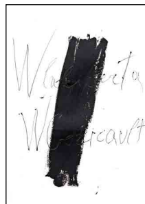
Jannis Kounellis, W la Libertà, W Gericault 40 x 30 cm, acrilico su carta